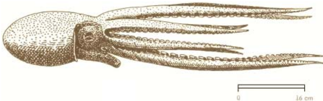
Fig. 3 Femmina di Ocythoe tuberculata in visione laterale (da Naef, 1923).