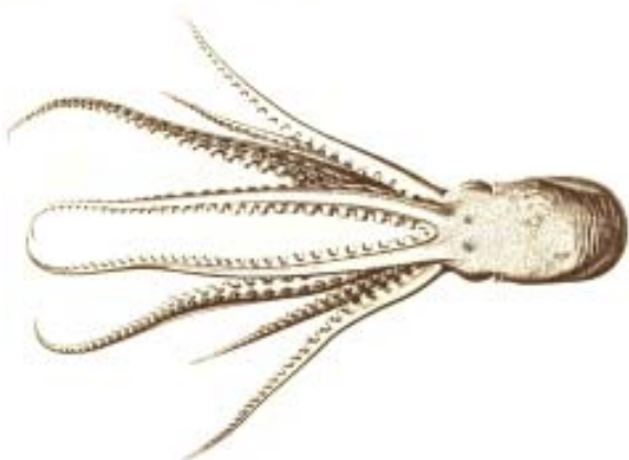
Fig. 1 Femmina di Ocythoe tuberculata in visione dorsale (da Jatta, 1896).

Per completare il discorso sui nomi di questo stupefacente animale, quello specifico, tuberculata , fu coniato nel 1814 da Rafinesque, poliedrico uomo di scienza franco-tedesco con trascorsi siciliani, con riferimento alla presenza sulla faccia ventrale del mantello di una sorta di rete di cordoncini cartilaginei dermici in rilievo, che qui e là protrude in tubercoli simili a bottoncini (Fig. 2); il dorso è, invece, liscio (Fig. 1). Infine, il nome ufficiale italiano di "polpo pignatta" fu scelto e imposto proprio per evocazione di quello napoletano (1).