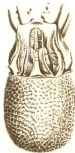
Fig. 2 Faccia ventrale del mantello di Ocythoe tuberculata femmina; l'imbuto è stato sezionato e aperto (da Jatta, 1896).

Fra i polpi olopelagici nostrani, la femmina del polpo pignatta è quella che più assomiglia ai polpi bentonici, a noi tutti più familiari grazie alla loro accessibilità nei mercati ittici. Il polpo pignatta, tuttavia, presenta una diversa proporzione del mantello rispetto al cefalopodio. Il mantello, la cui contrazione consente l'espulsione dell'acqua attraverso l'imbuto, è nettamente più ampio rispetto a testa e braccia che nel polpo comune; parimenti, anche l'imbuto è più ampio che negli altri ottopodi (Fig. 3). La spiegazione è ovvia: si tratta di adattamenti alla vita nectonica, che consentono di spostarsi con efficacia nel mare aperto, giacché mantello più ampio e più muscoloso vuol dire propulsione a getto più vigorosa. Come pure è ascrivibile agli adattamenti all'habitat pelagico la colorazione mimetica, scura sul dorso e chiara sulla faccia ventrale (si veda quanto già detto a tal proposito per il polpo palmato (3)). Ecco la bella descrizione fornita da Jatta (4): "Il colore predominante in questa specie è l'azzurro. La regione dorsale è bluastra con riflessi ametistini; è cosparsa di numerosi cromatofori rosso-bruni [...] La regione ventrale è di color grigio perlaceo, con riflessi argentini."